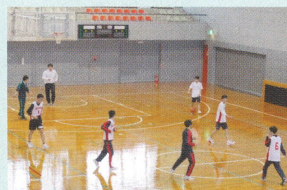
男子バスケットボール部