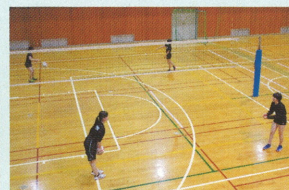
女子バレーボール部